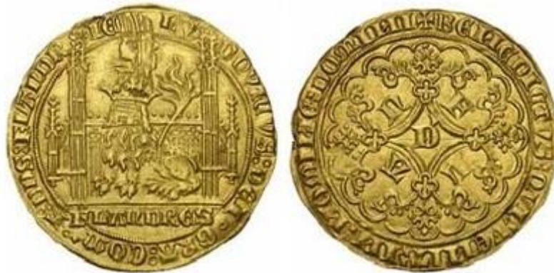
een zittende gehelmde leeuw, gewicht ongeveer 5 gram.