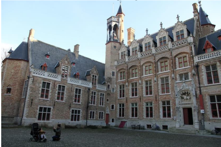
Woning van Gruuthuse, Brugge, nu museum

*Lodewijk van Gruuthuse –stadhouder van Holland, Zeeland en Friesland- was getrouwd met Margaretha gravin van Borssele, zus van Wolfert VI van Borssele, die Lodewijk van Gruuthuse na diens dood zal opvolgen als stadhouder ten dienste van de Bourgondiërs.