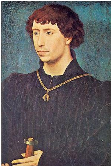
Karel de Stoute omstreeks 1460 geschilderd door Rogier van der Weyden

In 1466 bezoekt graaf Karel van Charolais – beter bekend als Karel de Stoute (Dijon 10 nov. 1433-Nancy, 5 jan. 1477)- het graafschap Holland. Karel van Charolais volgde zijn vader Filips de Goede (van Bourgondië) op na diens dood in 1467. Hij was al regent vanwege seniliteit van zijn vader sinds 1465. Kortom: hij was de leenheer/feitelijke machthebber in Holland.