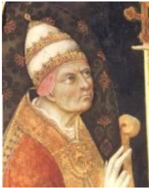
Paus Callixtus III

Dit pikte Philips van Bourgondië niet! Hoe ga je dat als hertog/graaf dan aanpakken? Dat wordt een één-tweetje met de paus, let maar op: