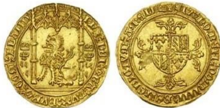
Gouden-, Brabantse- of Vlaamse Leeuw. Deze is 4,2 gram, geslagen onder Philips de Goede.